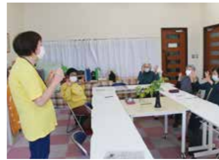
この日はジャンケンのポーズで脳トレ

「木曜カフェでみんな顔なじみになりました。ここで笑って過ごせるのがいいですね」と、みなさん木曜日を楽しみにしています。