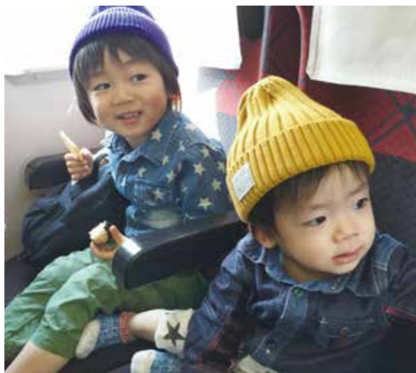
お子さんが小さい頃は、おにぎりや蒸した芋を持っておでかけ

出して酵素を摂取したりしました。大豆アレルギーを考慮してみそを変える工夫などもしていくうちに少しずつ症状が出なくなり1年〜2年ほどでお子さんたちのアレルギーは改善されました。