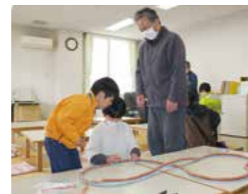
完成後は特設コースを走らせる実験

黒部おもちゃ病院では、毎月第1・3土曜日に東部児童センターでおもちゃの修理をしています。「壊れたかな?」と思ったら、まずは黒部おもちゃ病院に相談してみましよう。