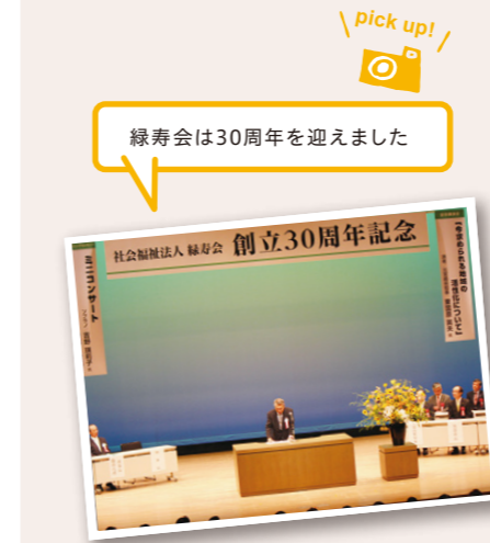
pick up! 緑寿会は30周年を迎えました

昭和61年に創立された社会福祉法人緑寿会は30周年を迎え、7月16日(土)に記念事業を行いました。記念式典では長年に渡りボランティア活動にご尽力された方々に感謝状が贈られたほか、元宮崎県知事の東国原英夫氏が「今求められる地域の活性化について」と題し講演されました。黒部市国際文化センターコラーレには関係者や市民が大勢集い、満員のカーターホールはお祝いムードに包まれました。