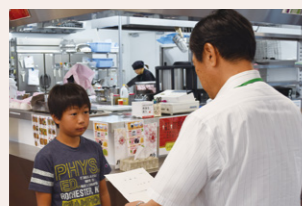
委嘱状を交付しました