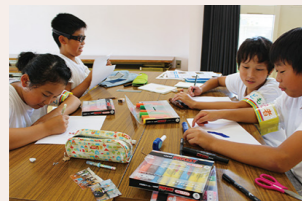
4人で協力してつくりました！