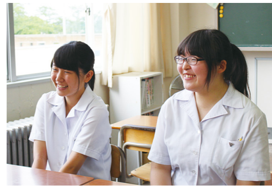
生徒たちのこれからの活躍が楽しみです

この他にも、生活環境科の生徒全員が加入する「家庭クラブ」が桜井高校にはあり、昭和26年から活動をはじめ、すでに65年の伝統があります。 このクラブでは、「地域に根差した活動」をモットーに、福祉施設訪問活動や学童保育ボランティア、交通安全マスコットの配布や研究活動なども行っています。