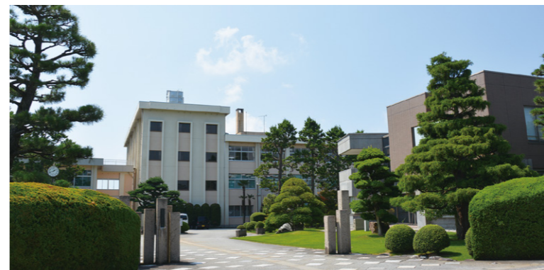
未来を担う、たくさんの生徒が学んでいます

積み重ねが生徒たちの成長と生活環境科の伝統をつくり出しているのではないかと感じました。 私たちの地域社会においては、これからさらに、人口減少社会を迎えて地域を支える担い手が不足していくことが考えられます。そして、これからの未来を担う人材の育成がより一層必要となってきました。この取材を通じ体験や経験から学ぶことと、成長の過程を長いスパンで考えていくことの大切さにあらためて気づかされました。