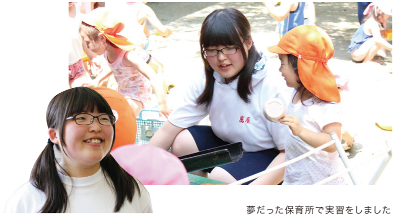
夢だった保育所で実習をしました

た」と話す一方で、学びと体験から将来の職をイメージしています。 「おじいちゃんやおばあちゃんが好んで将来は介護職に就きたいと思っっています。小学生の時の高齢者疑似体験はあまり考えずにやっていたんですが、高校での生活デザインという授業の中であらためて体験すると色々な視点で考えることができました」と、教科書で学習したことと、実体験を通じて学んだことのギャップや新しい気づきが生まれたそうです。「将来は、『あの人を目指して』と言われるような人になりたいです！」と笑顔で話してくれました。