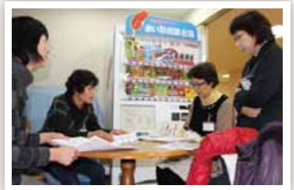
1.実習の前にはグループで念入りの打合せ