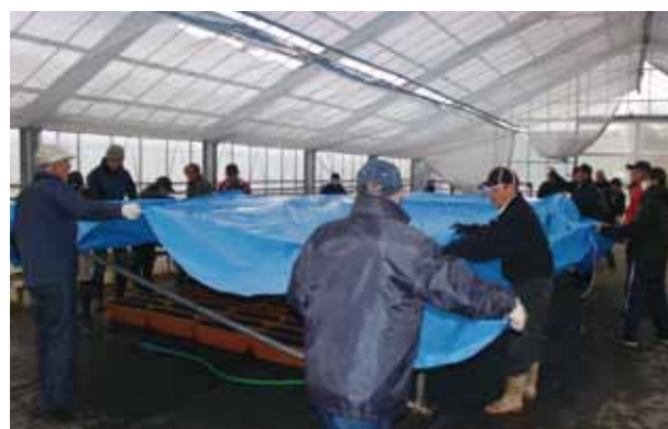
難しい問題も団結力で乗り切りました

そうとわかれば行動が早い若栗地区の皆さん。広いビニールハウス全てを暖房で温めるのは効率が悪いため、まずは、その場で短管パ