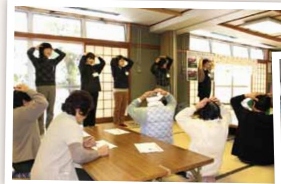
2.頭と体をつかった脳トレーニングを実践！