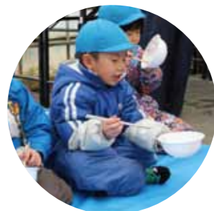
球根植えを終わると、参加者にぜんざいが振る舞われました

この広報誌が皆さんに届くころ、開業まであとわずか。新幹線をきっかけに地域をつないだチューリップ。3月14日は黒部宇奈月温泉駅へ。若栗の皆さんの思いがこもったチューリップが駅前をきれいに彩ることでしょう。