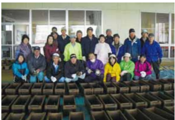
クラブの皆さんによる手づくりのプランターカバー

7月31日(木)には講習会が開かれ、チューリップの球根の特徴や植え込みの仕方を学び、11月13日(木)には間伐材を利用したプランターカバーも作られるなど、地区住民で一齐に球根を植える日に向けてクラブの方々は準備を進めてきました。