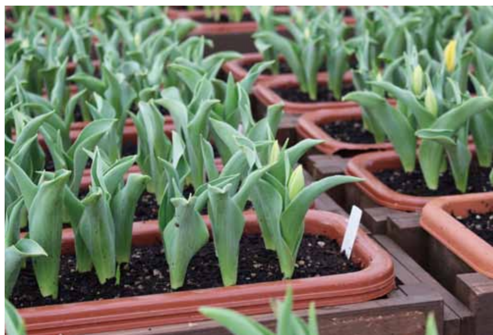
1月に植えられた球根は、もうここまで成長しています！

この広報誌が皆さんに届くころ、開業まであとわずか。新幹線をきっかけに地域をつないだチューリップ。3月14日は黒部宇奈月温泉駅へ。若栗の皆さんの思いがこもったチューリップが駅前をきれいに彩ることでしょう。