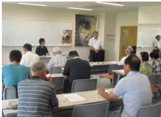
『若栗おもてなしフラワークラブ』での講習会

「クラブの名称を決める際に『おもてなし』という言葉を入れました。新川地域の貴重な新幹線の出来た地区ですので、いかにして、おもてなしするかが大切だと思っております。まずはチューリップを見て和んでいただきたいと思います」