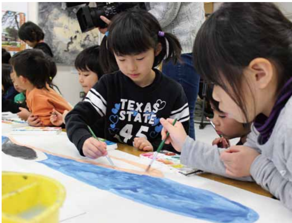
新幹線の紙芝居に着彩する住民の皆さん

3月14日、いよいよ北陸新幹線が開業し、市内に新しい駅が誕生します。 今回の特集は、黒部宇奈月温泉駅がある若栗地区の皆さんの取り組みについてご紹介します。 いたします。