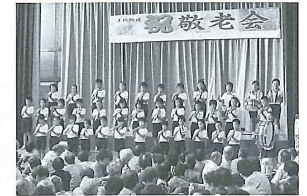
9月15日(日) 生地敬老会 参加者に楽器演奏を発表する生地小学校4年生