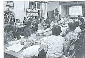
9月16日(月) 音沢敬老会 日頃の活動などを話しながら楽しく一日を過ごしました