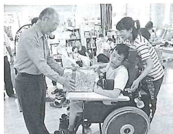
くろべ工房にて、 日本語教室 in 黒部より贈呈

9月中旬に、若栗保育所とくろべ工房にてキャンドルの贈呈式が行われました。若栗保育所にお届けしたキャンドルは、黒部市保育士会を通じて、市内の保育所に渡されます。