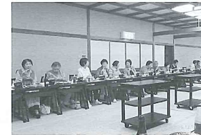
9月16日(月) 内山敬老会 参加者同士賑わいながら食事を楽しみました