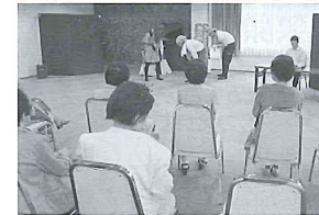
9月9日(月) 宇奈月敬老会 「黒部の街をよくし隊」による詐欺予防に関する寸劇