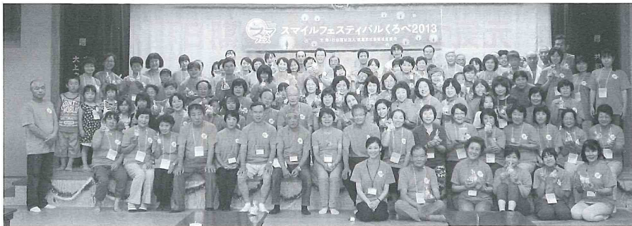
参加者のみなさま ありがとうございます！