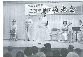
9月8日(日) 三日市敬老会 民謡、カラオケなどの発表で参加者は盛り上がっていました