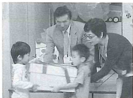
若栗保育所にて、黒部市民生委員 児童委員協議会より贈呈