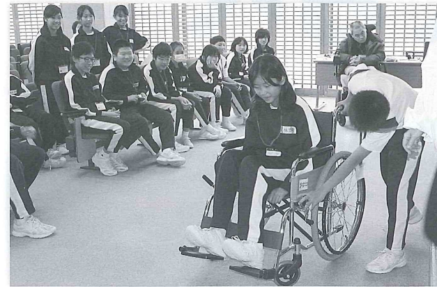
みんなの前でお手本。車いすの乗り降りにブレーキは欠かせない

11月12日(火)宇奈月小学校でバリアフリー教室が開催されました。6年生48人が車いすや高齢者疑似体験に初挑戦しました。