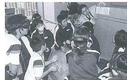
視力と聴力が80歳相当になるゴーグルとヘッドフォンをつけ信号の見え方を体験

心 の バ リ ア フリー について理解を深めるとともに、ボランティア意識を高め、誰もが自然に声をかけてサポートできる「心のバリアフリー」社会の実現をめざし、国土交通省北陸信越運輸局富山運輸支局が行っています。